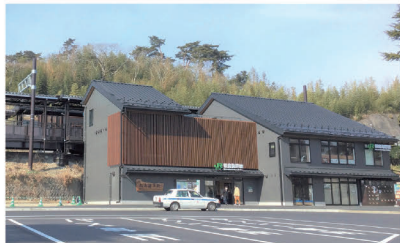
JR仙石線 松島海岸駅

当社では駅舎をはじめとした数多くの鉄道建築物を整備してきました。その他、豊かな「街」づくりのために、銀行や病院、ホテル、オフィスビル、住宅など、さまざまな施設的设计・施工を行ってきました。