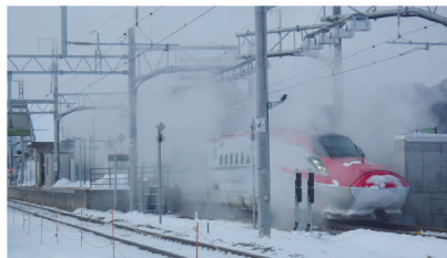
秋田新幹線 着落雪対策設備