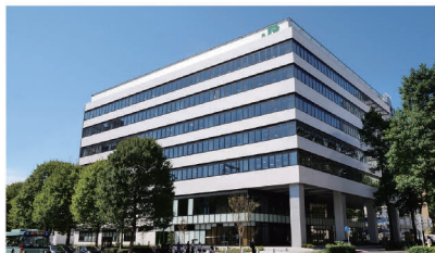
JR東日本 東北本部ビル