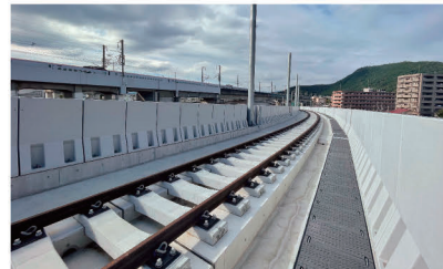
山形新幹線 福島駅アプローチ線

線路工事は、当社にとって基軸であり、他社には真似できない核となる分野です。JR・民鉄各線の線路メンテナンス工事はもとより、整備新幹線等の新線建設工事、災害復旧工事なども手掛けています。