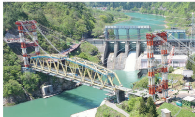
JR只見線 第6只見川橋りょう

橋りょうの架設や新駅の設置・既存駅の改築、駅前広場の整備など幅広い土木の実績があります。当社の強みである鉄道関連の橋りょうでは、さまざまなケースに対応できるノウハウを蓄積し、数々の実績を重ねてきました。