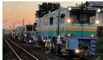
JR在来線 大型機械による線路メンテナンス